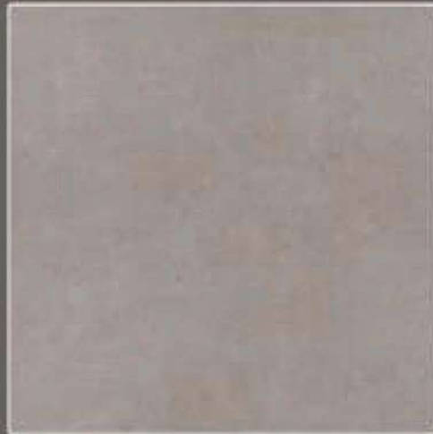
SOFT TOUCH COL. 33