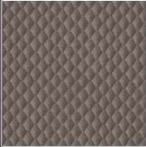
CONCEPT COL. 36