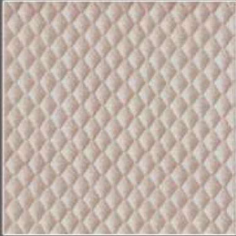
CONCEPT COL. 09