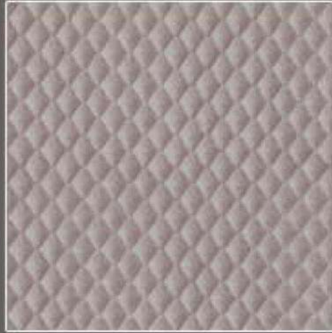
CONCEPT COL. 33